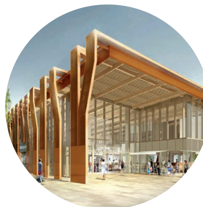
Les nouvelles halles