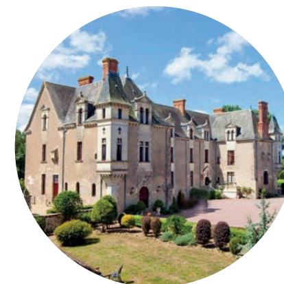
Château de la Vérie