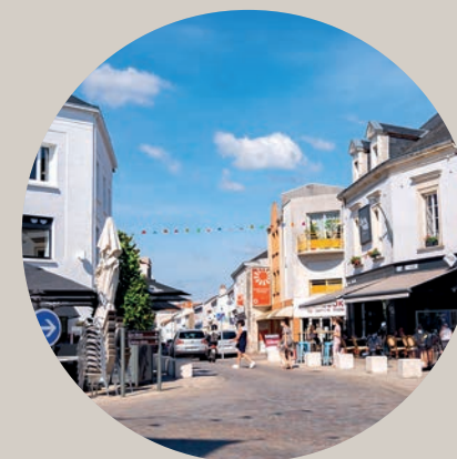
Rue commerçante du centre-ville