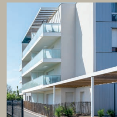
VILLA IODÉA Notre-Dame-de-Monts