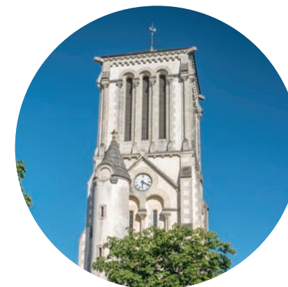
Clocher de l'église Notre-Dame