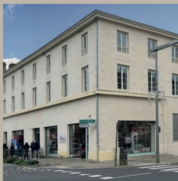
IMPÉRIO La Roche-sur-Yon

À ce jour, les agences Groupe Edouard Denis de La Rochelle et de Nantes ont déjà livrées 150 logements en Vendée.