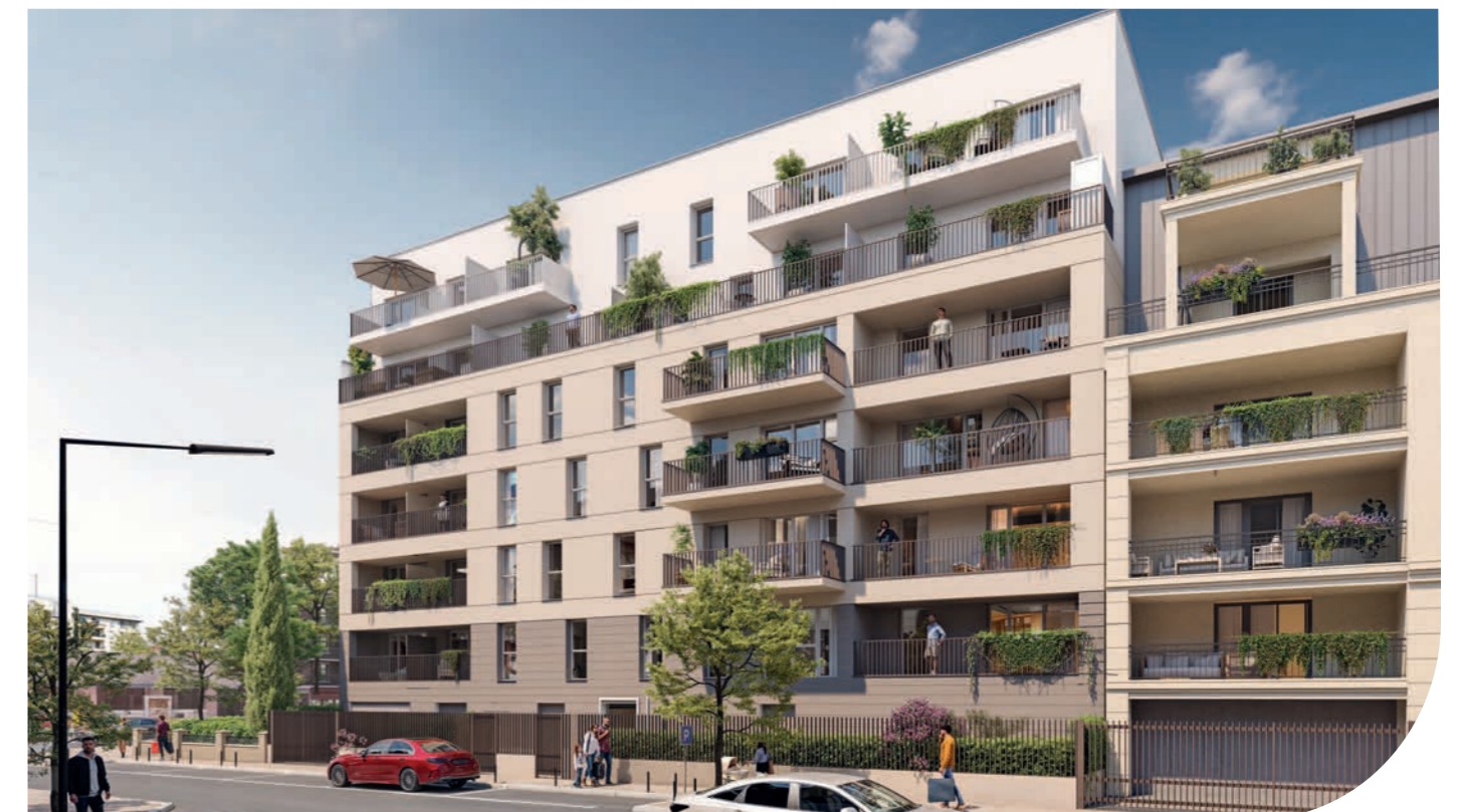
Vue depuis l'avenue Jean Jaurès

Ses volumes élégants, ses lignes lumineuses et ses espaces extérieurs généreux composent un lieu de vie pensé pour le confort et la sérénité.