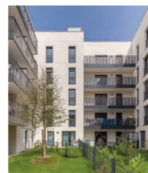
Villa en Scène - DRANCY

VINCI Immobilier compte parmi les intervenants économiques majeurs de Ile-de-France, avec des réalisations qui font référence.