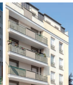
En Aparté - DRANCY