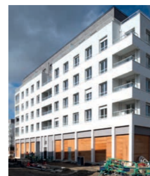
Les Terrasses Marceau - DRANCY