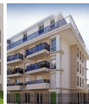
Quatuor - DRANCY