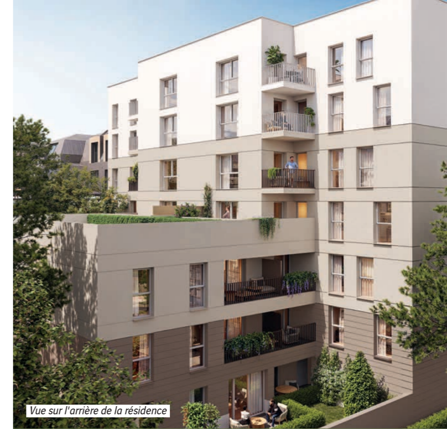
Vue sur l'arrière de la résidence