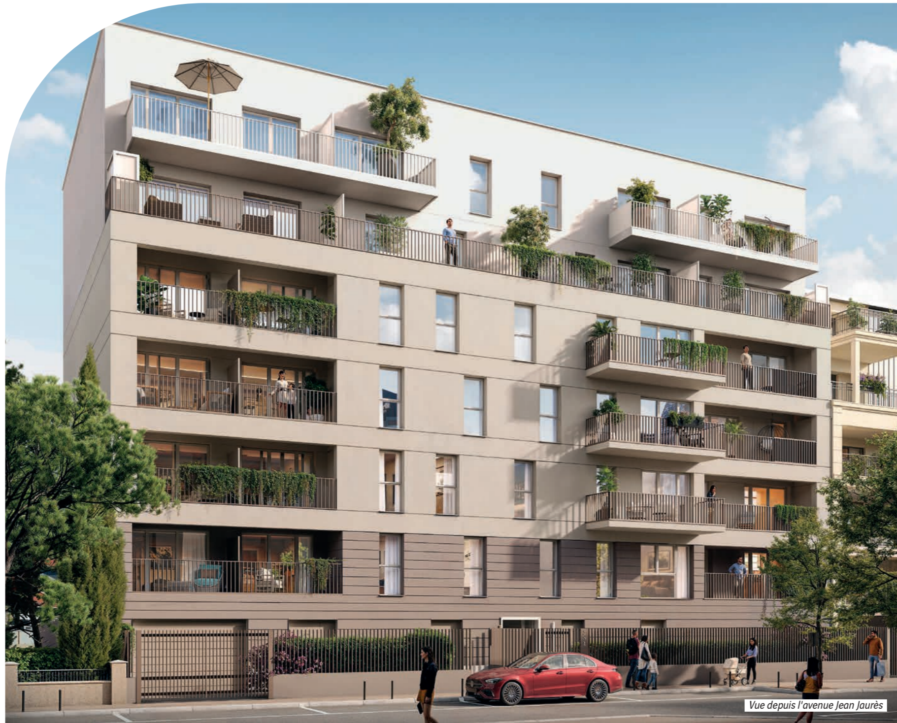
Vue depuis l'avenue Jean Jaurès