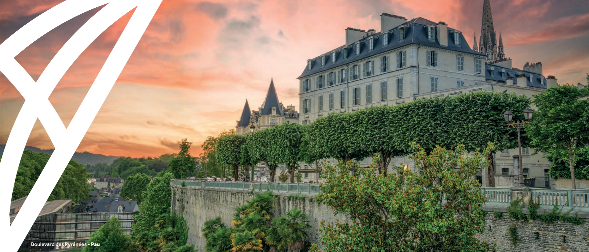
Boulevard des Pyrénées - Pau