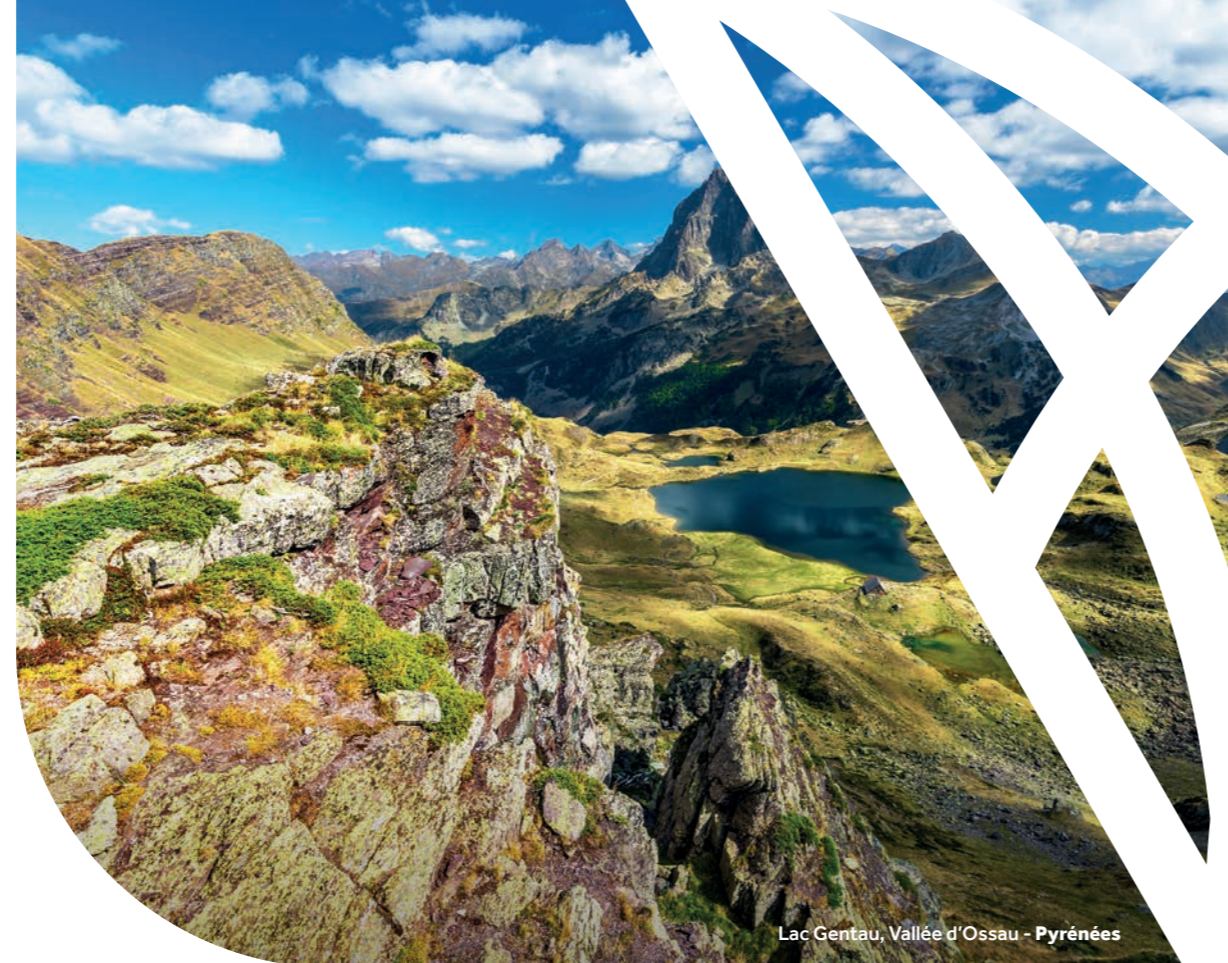
Lac Gentau, Vallée d'Ossau - Pyrénées