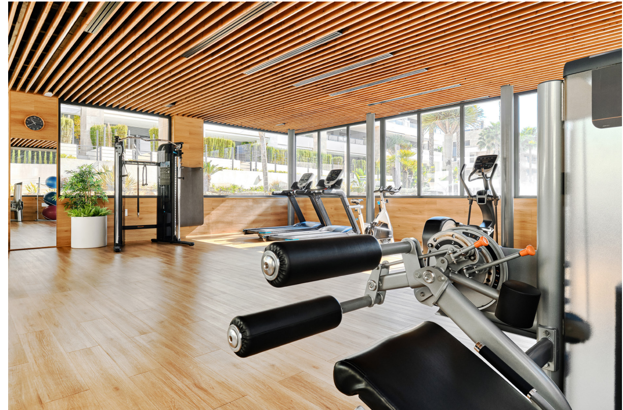
UNE SALLE DE SPORT ÉQUIPÉE EN LIBRE SERVICE

WIFI HAUT-DÉBIT DANS ESPACES COLIVING ET SALLE DE SPORT