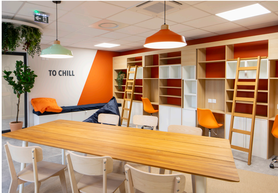
UN ESPACE COWORKING