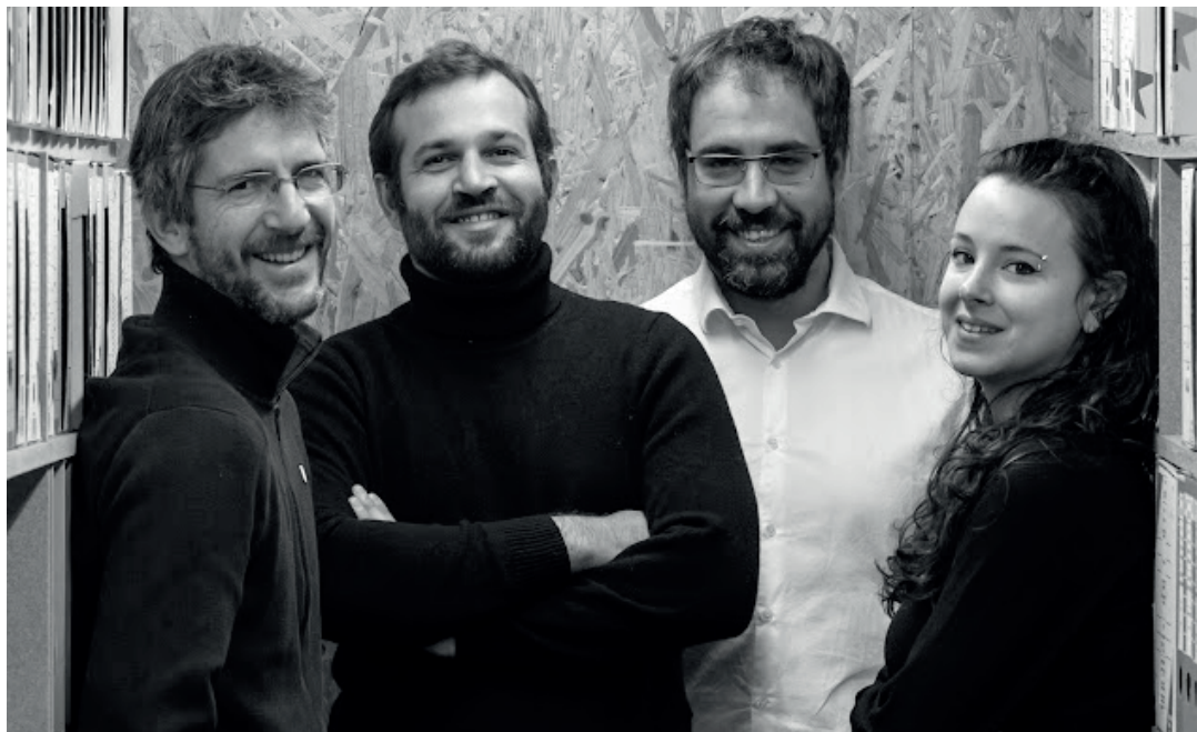
Cabinet Satori, Architecte de l'opération, décrit son approche :

“ Nous avons cherché à fabriquer des espaces de vie fluides, respectueux de l'environnement et surtout aussi un cadre de vie apaisés tel que peut offrir la Roque d'Anthéron. ”