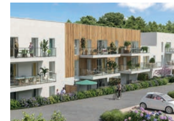
(RE)SOURCES Rue des Sources (L'Huisserie)