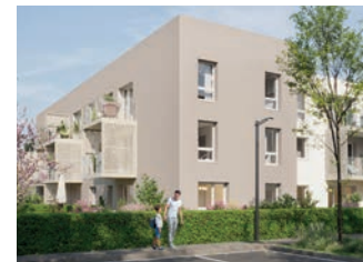
LES JARDINS DE PHAÉ Rue du Bourny (Laval)