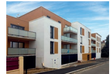
ROSA ALBA Rue de la Fleurière (Laval)