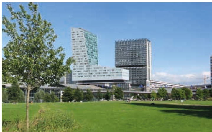
Euralille, 3 e plus important quartier d'affaires de France à seulement quelques minutes

Plus proche de l'hyper centre lillois que certains quartiers de Lille, la Madeleine est une ville prisée où il fait bon vivre. Riche d'une histoire de près d'un siècle, elle cultive à merveille le charme de son patrimoine et offre l'essentiel d'une grande ville bien dans son époque avec de nombreux commerces, services et infrastructures de loisirs. Verdoyante et animée, la ville profite d'une position stratégique au cœur de la Métropole Lilloise et offre à ses habitants tous les avantages des grands centres économiques, étudiants, culturels ou commerçants, sans leurs inconvénients.