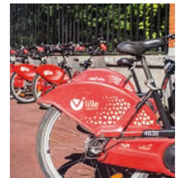
La station de vélo libre-service à 2 pas

Commerçante et riche en activités, la Madeleine est une ville à taille humaine où l'on ne s'ennuie jamais, parfaitement pensée pour une vie de famille épanouie.