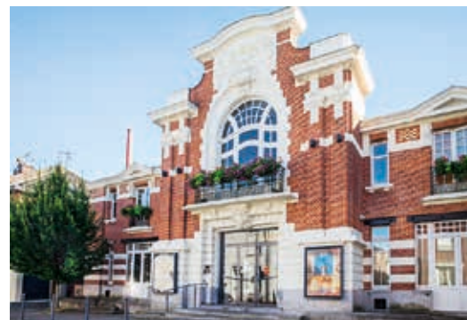
Le cinéma Colisée Lumière