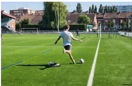
Le club de football à proximité de l'école Kléber