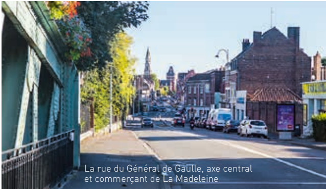
La rue du Général de Gaulle, axe central et commerçant de La Madeleine