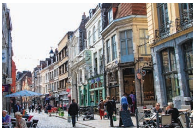
Le charme et l'animation du Vieux-Lille à proximité

Pour prendre l'air le week-end, vous avez le choix entre la Belgique voisine, Londres à moins de 2h ou la mer du Nord et la Côte d'Opale. La 1 ère station balnéaire n'est qu'à 1h, et le Touquet, à 1h45 ! Très bien située au cœur du dynamisme économique régional, parfaitement connectée au réseau de transports, conviviale et pleine de charme, la deuxième ville la plus densément peuplée des 90 communes de la Métropole n'en finit plus de séduire investisseurs et nouveaux habitants.