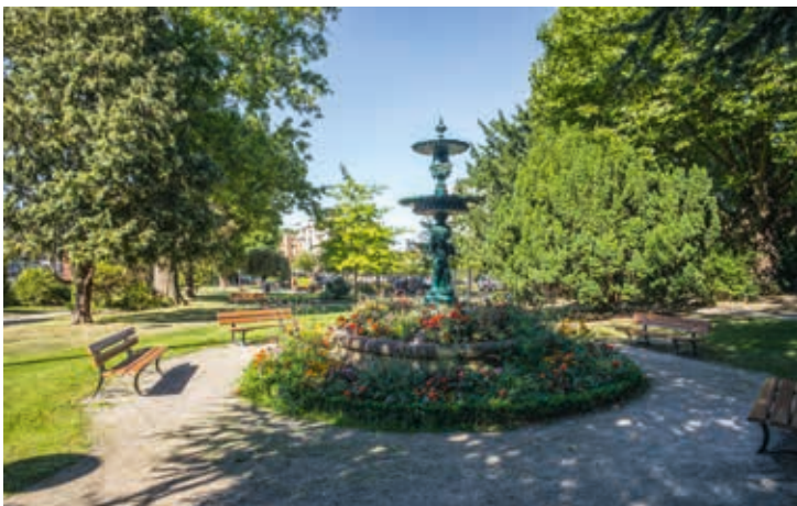
Le square du Château, juste en face de la résidence