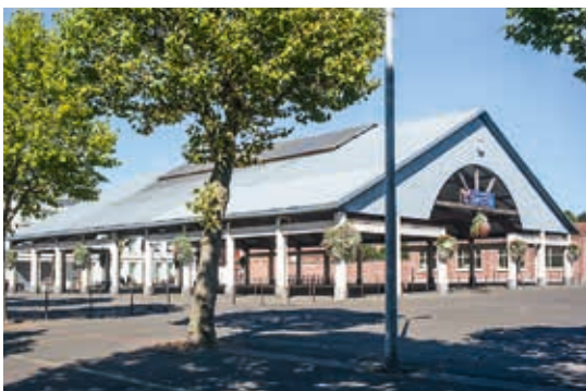
La halle du marché

Idéalement située toute proche de la gare, l'Interface vous permet de profiter d'une qualité de vie recherchée.