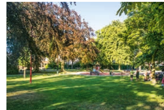
Le jardin Saint-Charles