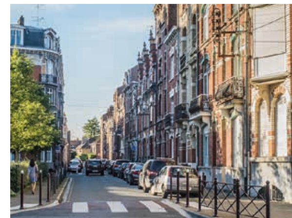
Des rues élégantes bordées de belles demeures à l'architecture flamande

Toute proche des gares de Lille Flandres, Lille Europe et de l'aéroport de Lille-Lesquin, la Madeleine est desservie par le TER, le bus, le tramway ainsi que par les autoroutes A1 et A25 via le périphérique lillois. Ce remarquable réseau de communication offre à la ville une attractivité grandissante, la plaçant à la fois au cœur de la métropole lilloise et au centre des échanges européens. Aux portes de la ville, le quartier d'affaires d'Euralille avec ses tours futuristes abrite la gare internationale et un des plus grands centres commerciaux de France avec plus de 120 boutiques.