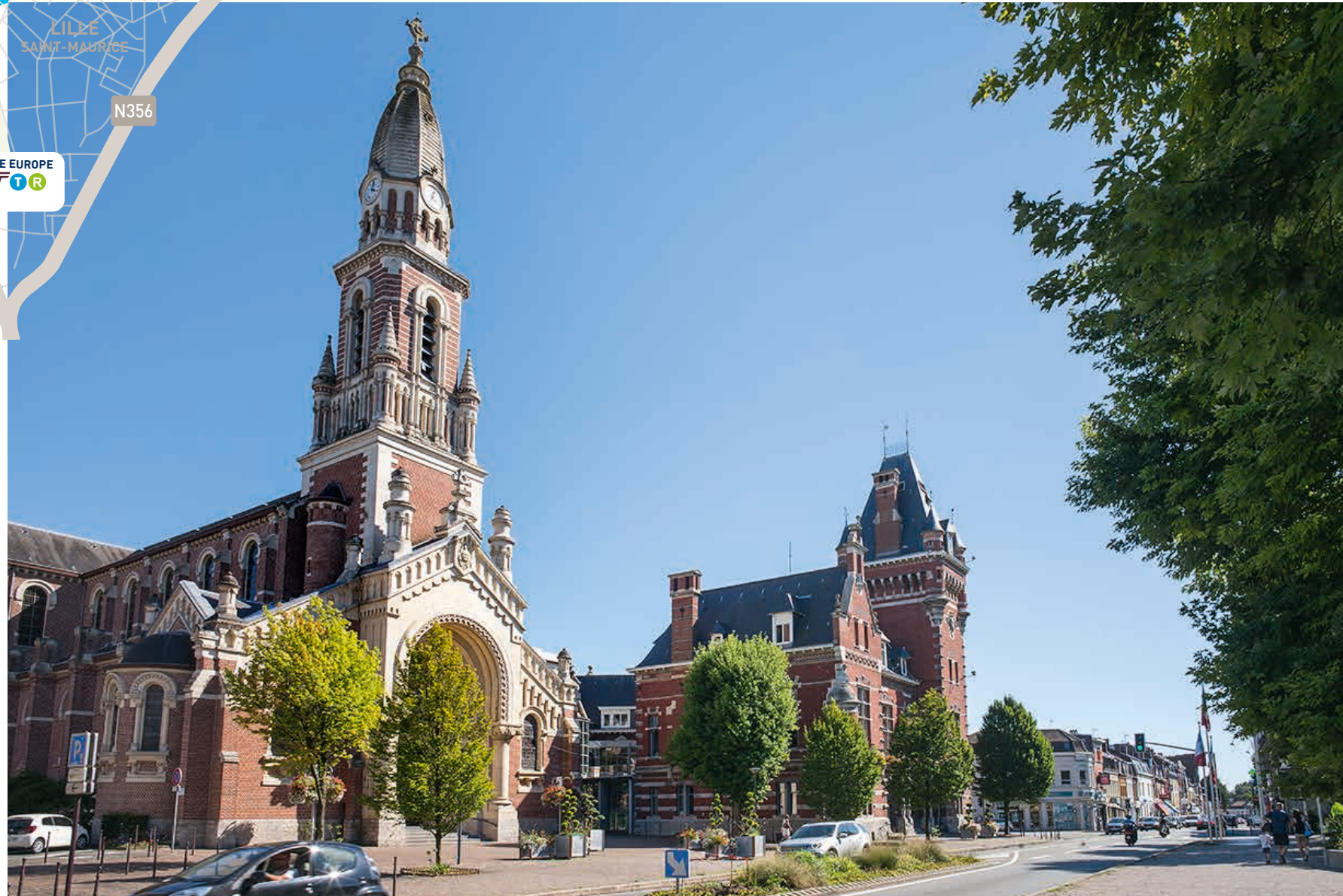
L'église Sainte-Marie-Madeleine et la mairie en centre-ville

Aux portes de Lille et proche de la frontière belge, cette ville pleine d'histoire et de cachet cultive son art de vivre et son identité typiquement flamande.