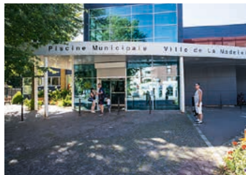
La piscine municipale