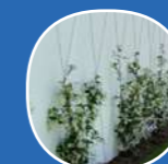
Végétalisation façades garages

Avec ses façades lumineuses, ses lignes épurées et ses espaces extérieurs généreux, chaque appartement offre une connexion unique avec la nature environnante. Les balcons et terrasses permettent de profiter pleinement des vues dégagées sur la nature, tandis que les grandes ouvertures baignent les intérieurs de lumière naturelle, pour une qualité de vie sans pareille.