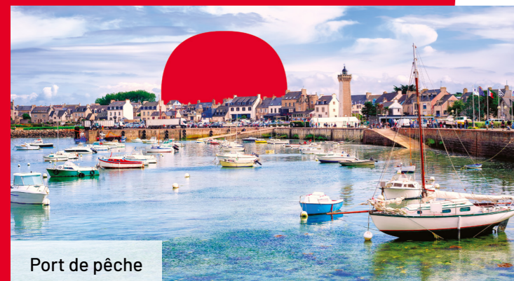
Port de pêche