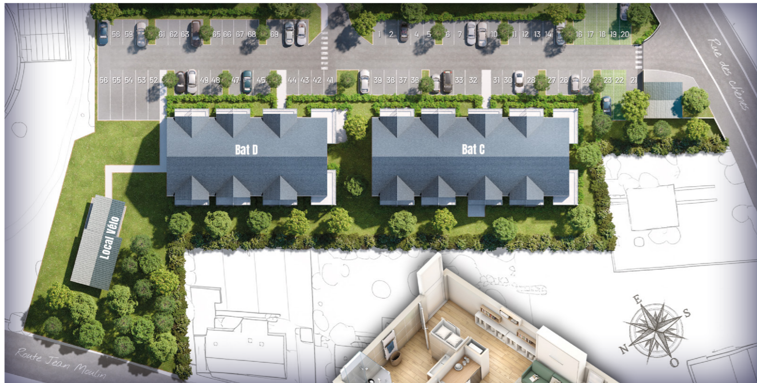
EXEMPLE DE T1 bis