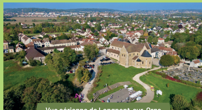
Vue aérienne de Longpont-sur-Orge

Située en Essonne, Longpont-sur-Orge séduit par son atmosphère paisible et son environnement verdoyant. Bordée par la vallée de l'Orge et entourée de nombreux espaces naturels, la commune invite à profiter d'un art de vivre agréable, rythmé par les saisons et les paysages. À taille humaine, elle cultive un esprit convivial et résidentiel, où nature, simplicité et qualité de vie composent un équilibre rare.