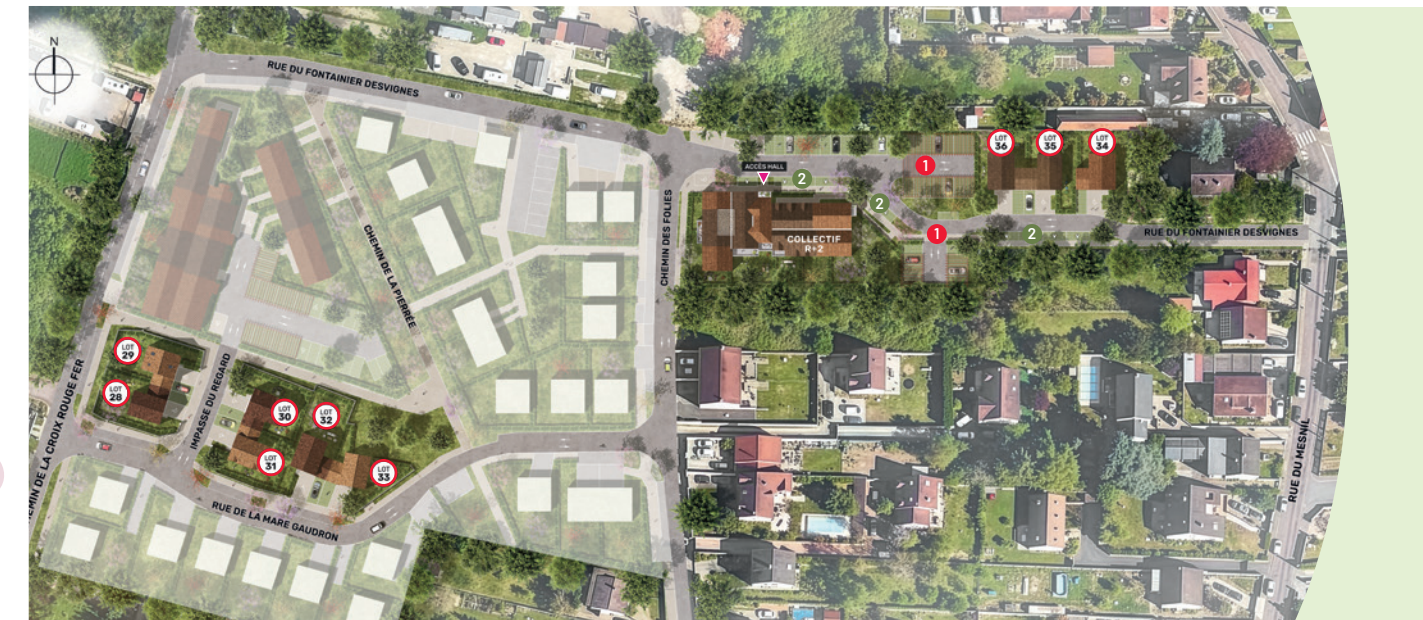
○ Maisons avec garage ▶ Accès hall appartements ① Places de parking extérieures ② Places visiteurs

Chaque maison affirme une identité propre grâce à une variation de volumes, de teintes et de matériaux, mêlant enduits, parements et éléments de bardage. Les toitures aux pentes différenciées rythment l'ensemble. Toutes disposent d'un garage intégré et d'une place de parking extérieure. L'organisation intérieure sépare les espaces de vie au rez-de-chaussée et les espaces nuit à l'étage.