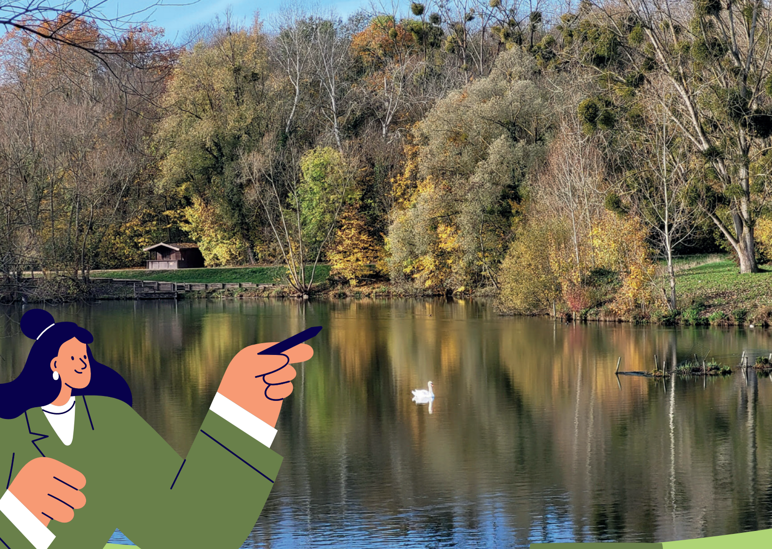
Vallée de l'Orge