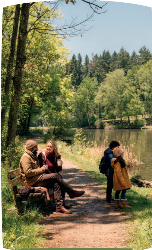
Bords du Lac de Lormoy