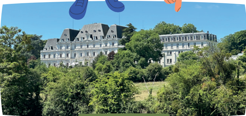
Château de Lormoy

Idéalement située, la résidence bénéficie d'un accès privilégié à la zone commerciale de La Croix Blanche à Sainte-Geneviève-des-Bois, aux gares RER voisines permettant de rejoindre facilement Paris, ainsi qu'au bassin d'emploi d'Évry-Courcouronnes.