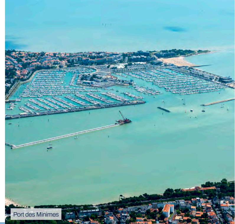
Port des Minimes

Les Minimes conjuguent harmonieusement la tranquillité d'un quartier familial avec une vie culturelle animée portée notamment par le Musée Maritime et des événements nautiques réguliers comme des régates ou des compétitions de voile.