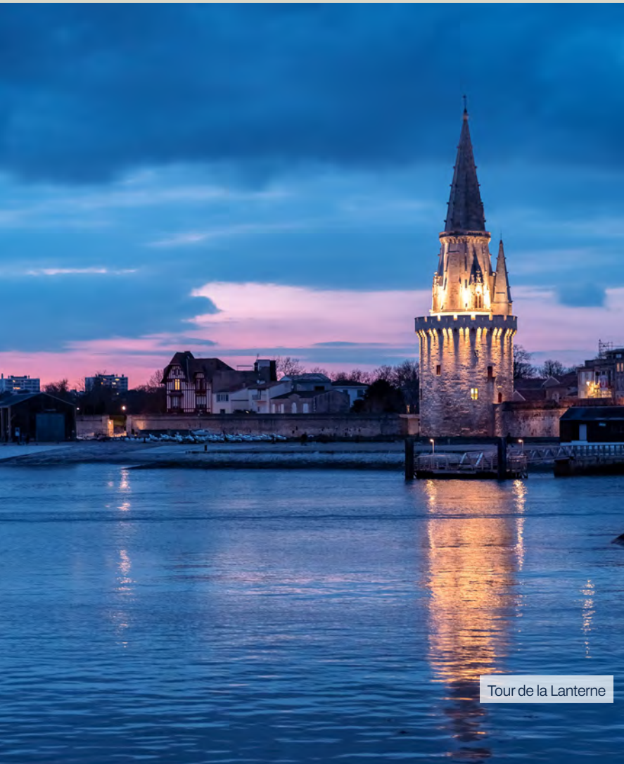
Tour de la Lanterne

Ici, chaque saison révèle un charme unique, chaque quartier une atmosphère particulière, et chaque détour une promesse de découverte. Choisir La Rochelle, c'est bien plus que choisir une ville: c'est adopter un mode de vie unique, au cœur d'un environnement privilégié.