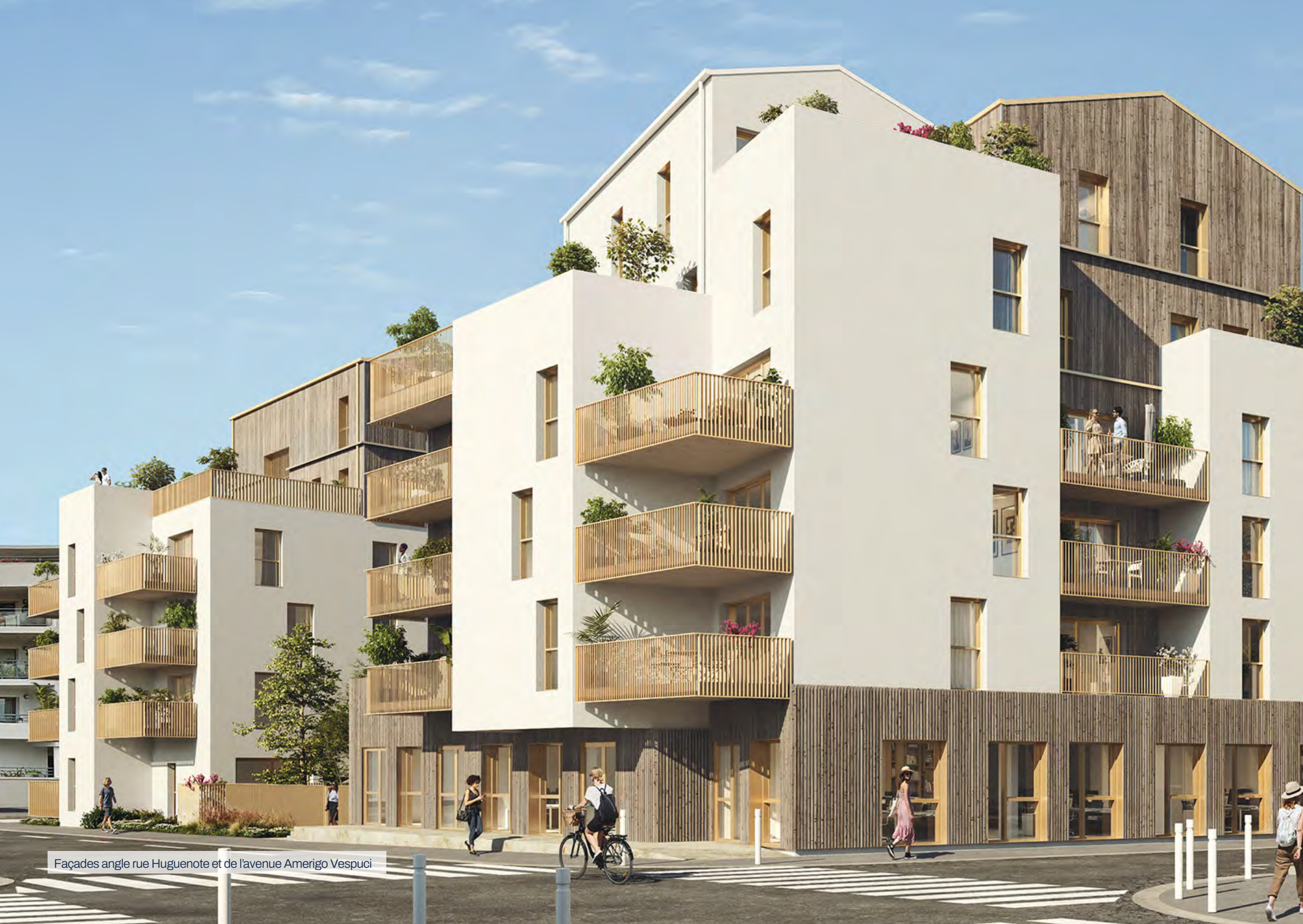
Façades angle rue Huguenote et de l'avenue Amerigo Vespucci