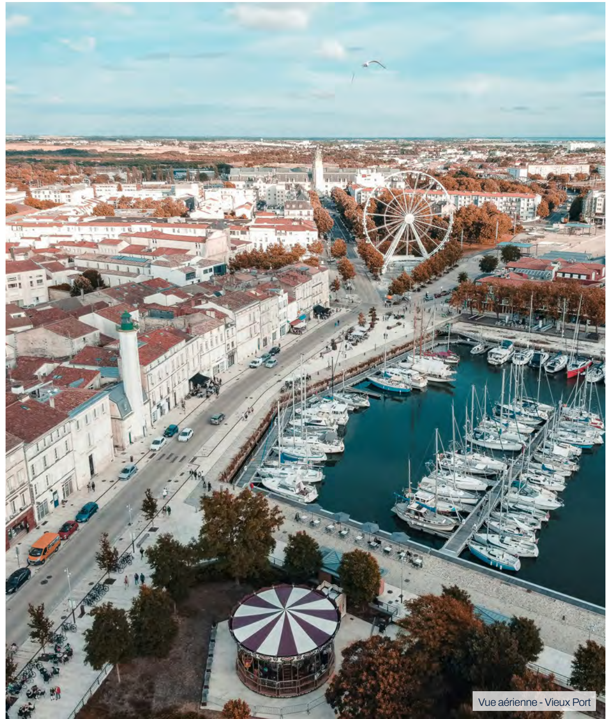
Vue aérienne - Vieux Port