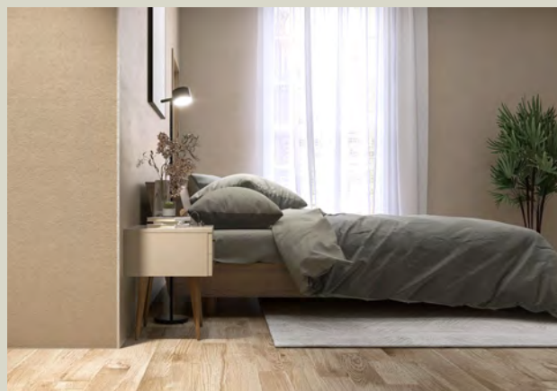
Visuels d'ambiance - non contractuels