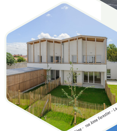
Florilège - rue Anne Forestier - La Rochelle