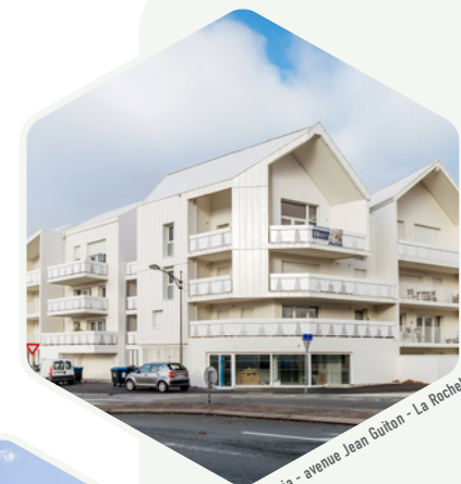
Amaria - avenue Jean Guiton - La Rochelle