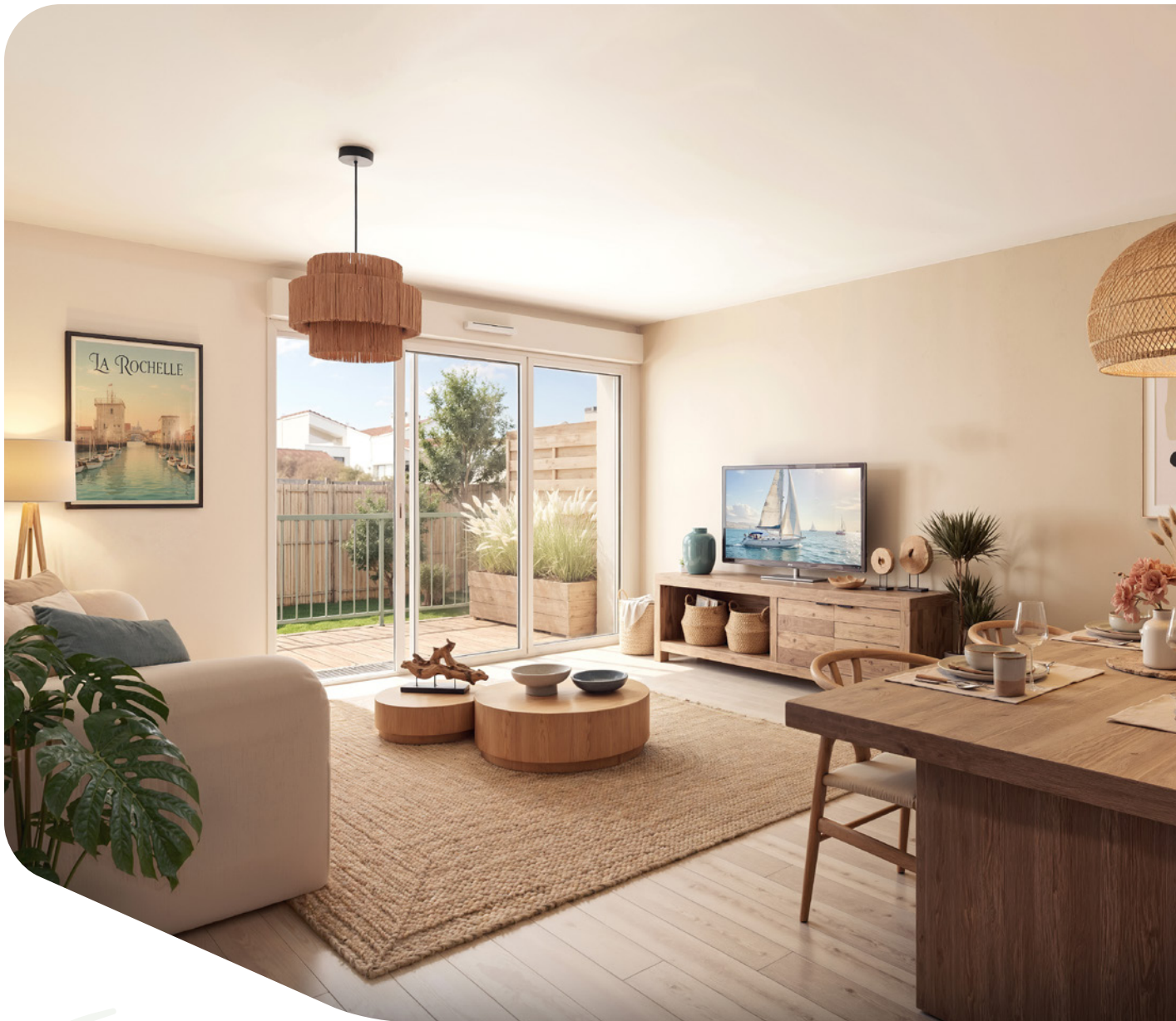
Illustration non-contractuelle - Maisons vendues non-meublées