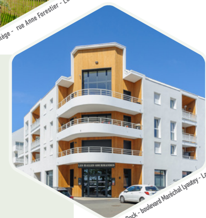
Espirit Dock - boulevard Maréchal Lyautey - La Rochelle