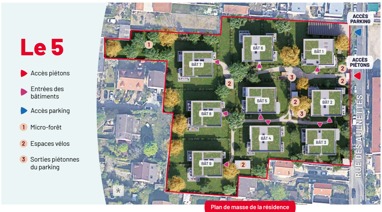
Plan de masse de la résidence