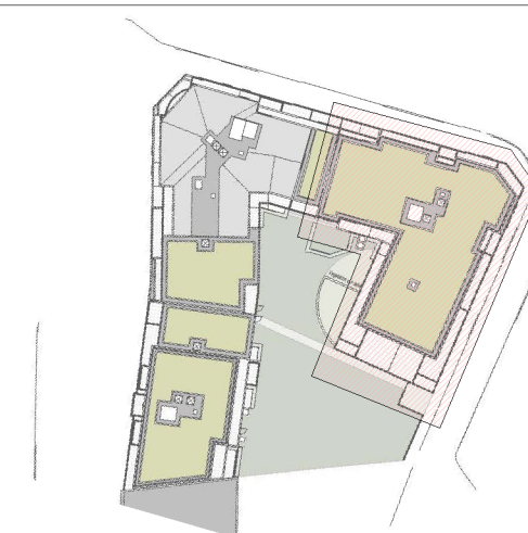
Bâtiment 3 Plan masse

Le présent document exprime la figure et les dispositions générales de l'appartement. Les dimensions et surfaces peuvent varier en fonction des nécessités techniques ou administratives de la réalisation, tant en ce qui concerne les dimensions libres que l'équipement (retombées de poutre, soffites, aîlages, faux-plafonds). Les côtes indiquées sont approximatives, les canalisations ne sont pas représentées. Les équipements de la cuisine ne sont pas fournis et les dressing sont des espaces non aménagés. Les quadrillages dessinés ne sont pas des calepinages. Les gabarits des pièces répondent aux dispositions réglementaires. Toute modification est soumise à l'accord préalable de la société et du bureau de contrôle. Aucune modification affectant l'installation électrique, la plomberie ou le cloisonnement nje pourra être prise en compte après le démarrage des travaux. Dans le cadre des TMA, il ne sera pas accepté de modifications sur la structure, les portes d'entrée, les gaines techniques, la position des tableaux électriques et les menuiseries extérieures