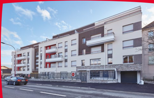
LE CARMIN 103, avenue Gabriel Péri