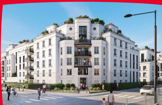
LES JARDINS ALBERT 1 ER 29-45, rue Albert 1 er