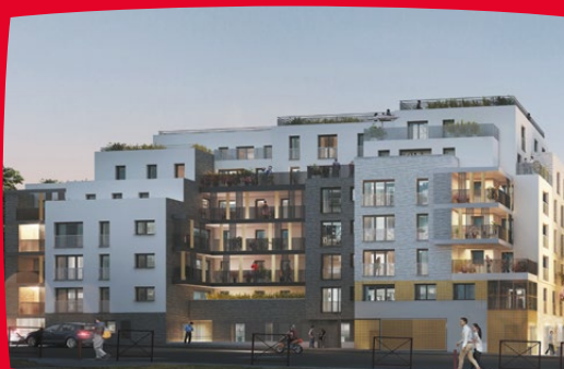
EQUINOX 9, rue Lucien Sampaix