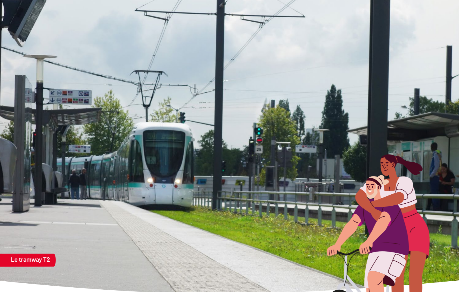
Le tramway T2