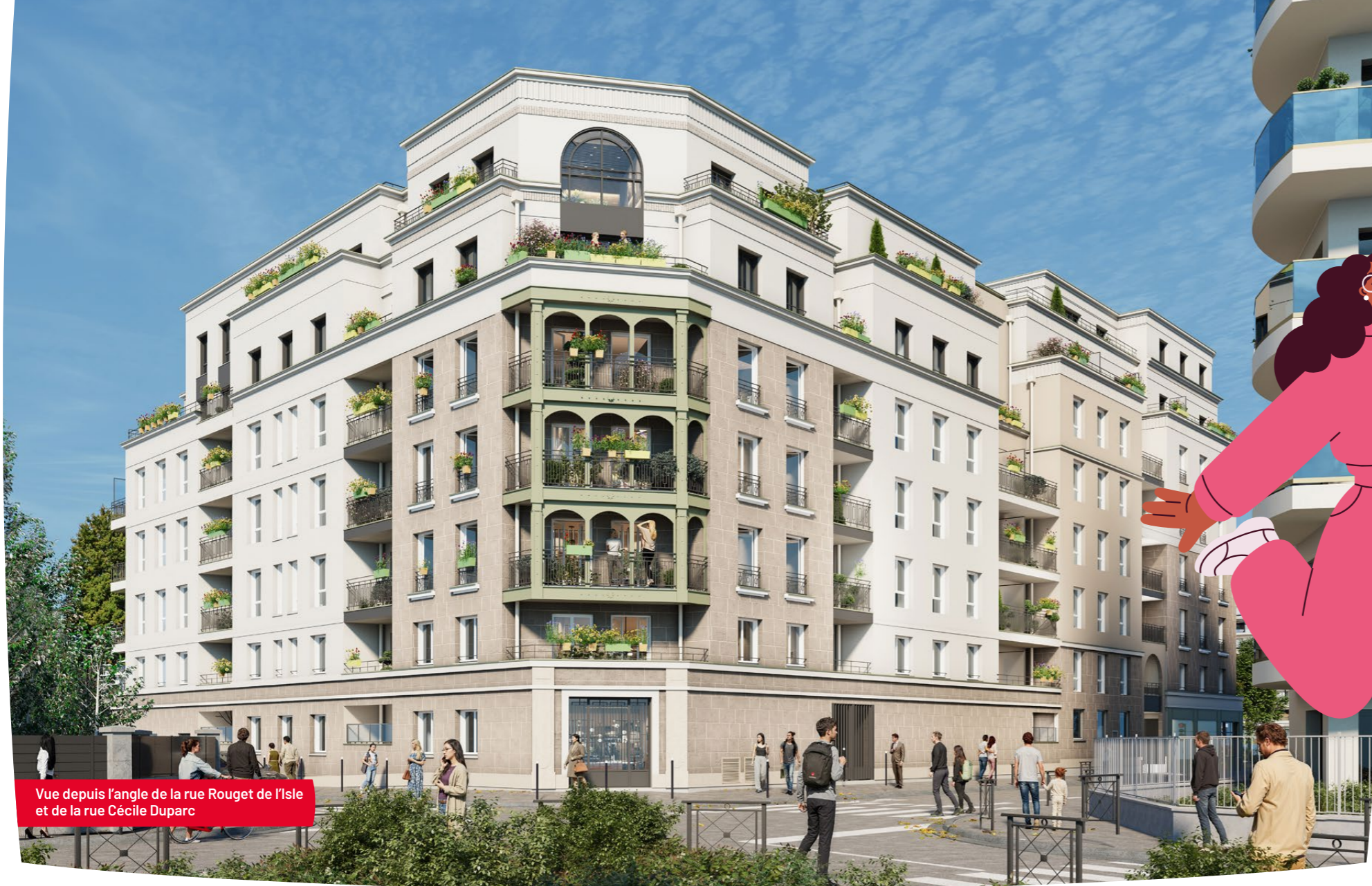
Vue depuis l'angle de la rue Rouget de l'Isle et de la rue Cécile Duparc