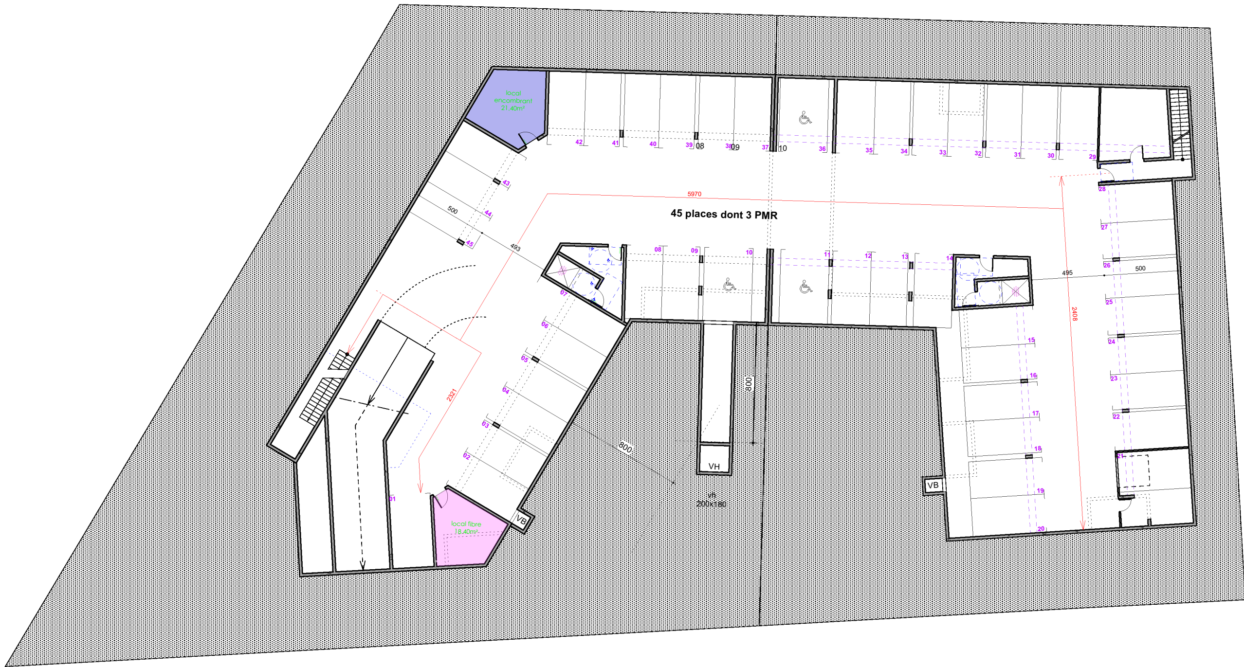
Plan de Sous-sol éch: 1/250ème