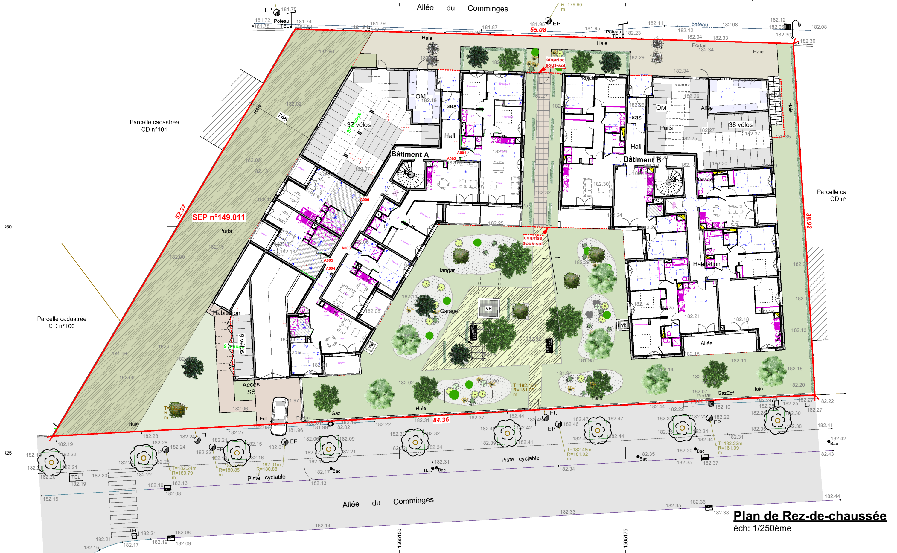
Plan de Rez-de-chaussée éch: 1/250ème