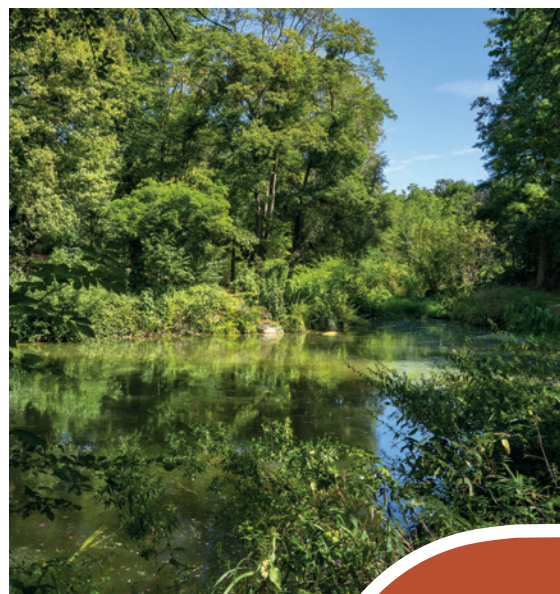
Parc du Morbras