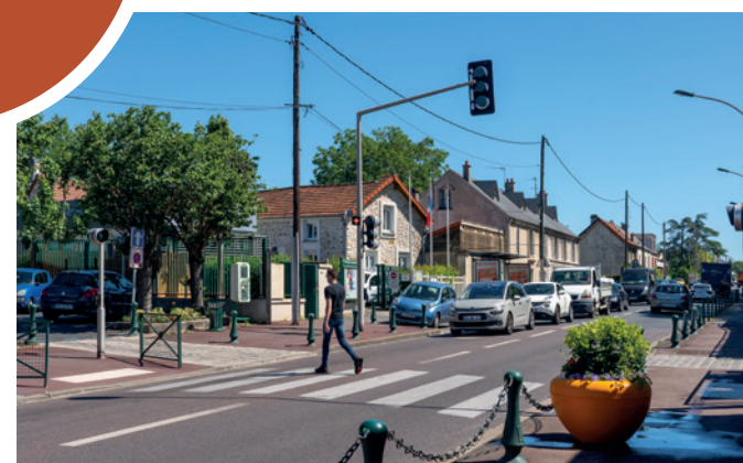
Avenue Wladimir d'Ormesson