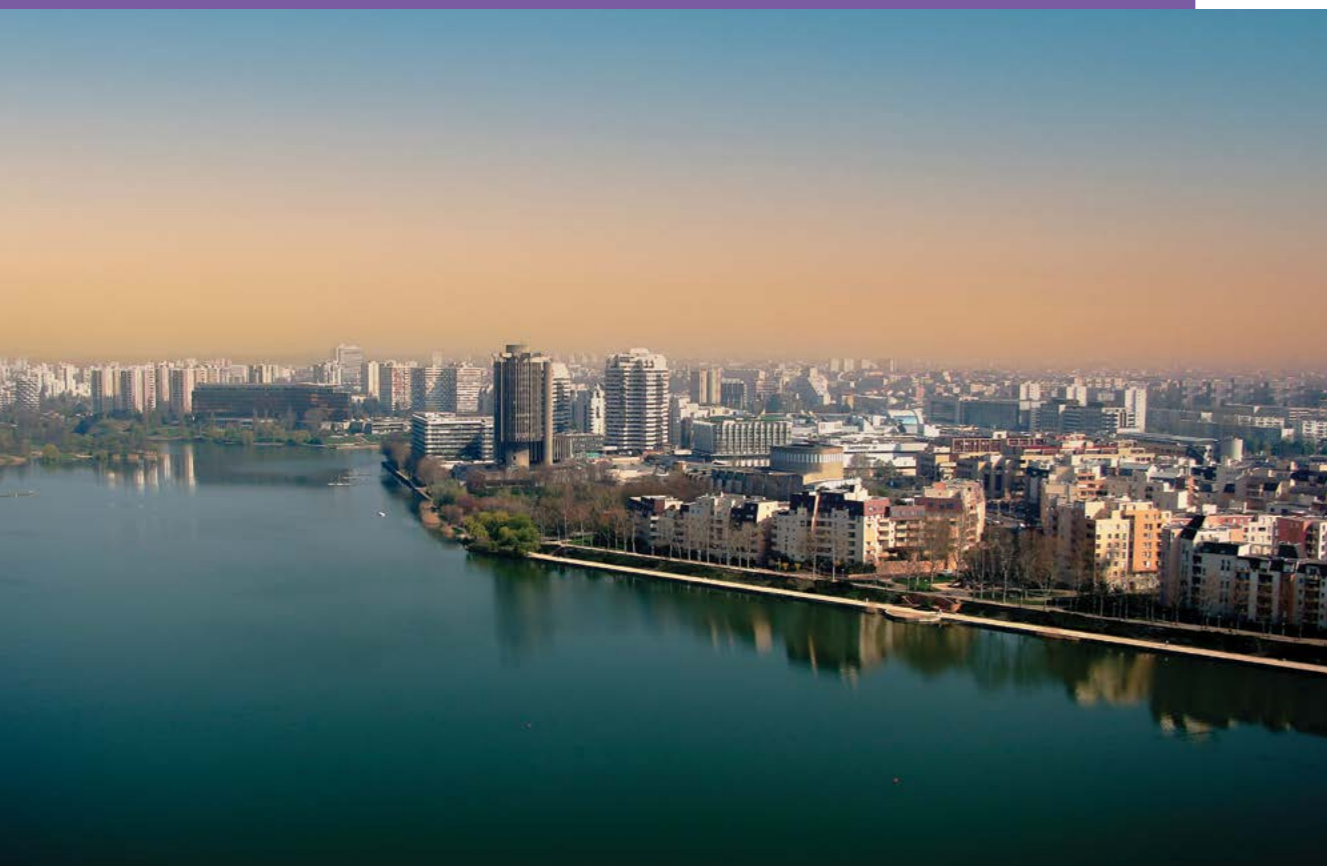
Vue aérienne sur Créteil et son lac