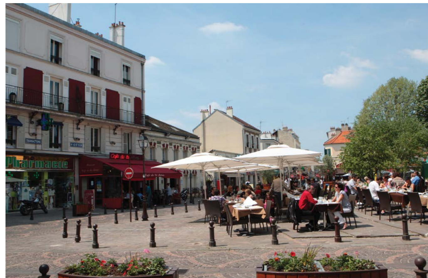
Le centre-ville de Créteil