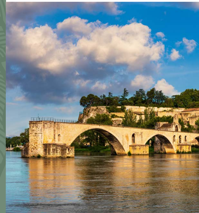
LE PONT D'AVIGNON

Ici, on gagne du temps sans renoncer au confort. Une ville vivante, accessible, et étonnamment apaisée. Un cadre parfait pour conjuguer liberté, proximité et qualité de vie.