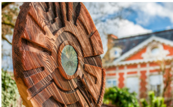
Sculpture « Civilisation 12 » - Artiste Arnaud POTTIER Résidence L'Orée de Barbieux à CROIX

Votre cadre de vie mérite d'avoir «sa» personnalité, c'est pourquoi nous intégrons l'Art au cœur de nos résidences. À travers la charte « 1 immeuble, 1 œuvre », chaque projet accueille la création d'un artiste local, en parfaite harmonie avec l'architecture et les espaces partagés. Plus qu'un simple embellissement, chaque réalisation apporte une touche unique de caractère, de poésie et d'inspiration.