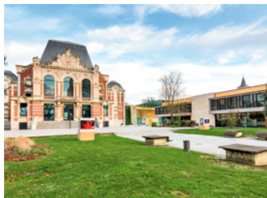
Théâtre de Saint-Amand-les-Eaux