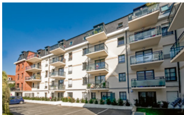
Le Clos du Hainaut - VALENCIENNES