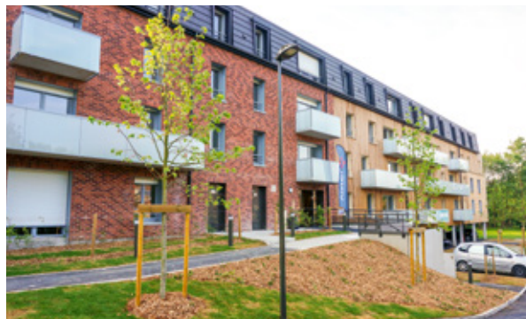
Le Clos de la Rhonelle - VALENCIENNES

VINCI Immobilier compte parmi les intervenants économiques majeurs dans les Hauts-de-France, avec des réalisations qui font référence.