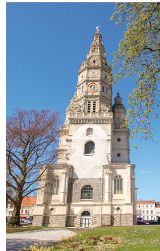
Tour abbatiale de Saint-Amand-les-Eaux