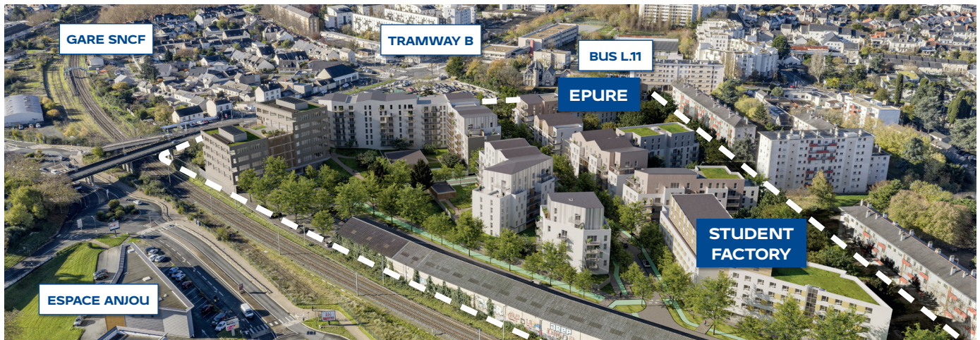
Vue aérienne du futur Quartier Montaigne