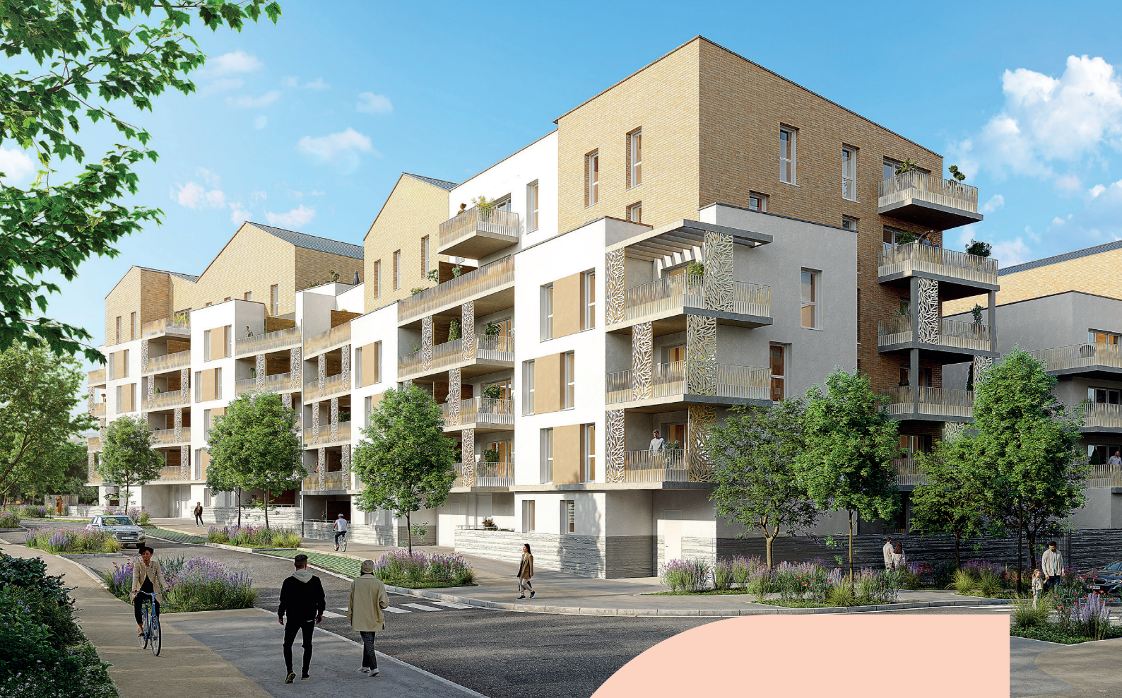
Vue sur le Bâtiment B depuis la Venelle nouvelle Nord/Sud