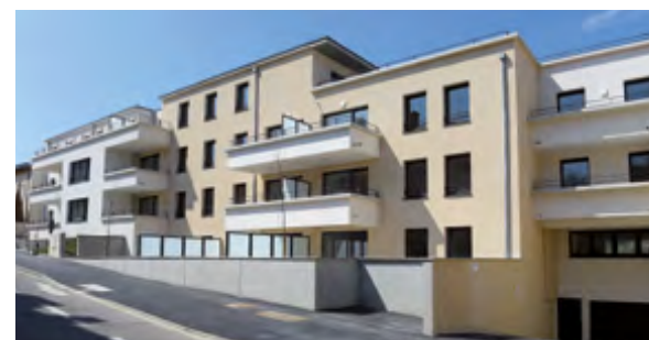
Résidence POINT DE VUE, Villers-Lès-Nancy – Livrée en 2019

VINCI Immobilier compte parmi les intervenants économiques majeurs du Grand Est, avec des réalisations qui font référence.