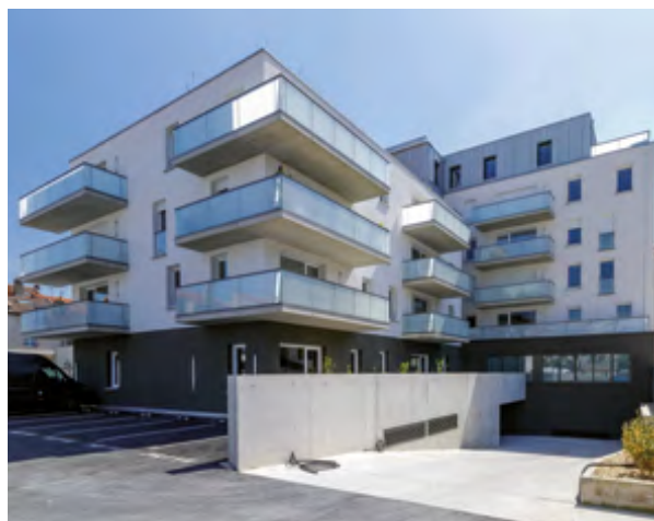
Résidence ARTEMIS, Saint-Max – Livrée en 2022

Nos logements sont imaginés en harmonie avec votre mode de vie. Espaces lumineux, matériaux de qualité, extérieurs généreux, isolation thermique et acoustique, optimisation des volumes... Chaque détail est pensé avec soin, chaque mètre carré valorisé et nos plans déjà meublés : une exigence de conception au service de votre confort d'été comme d'hiver. Pour longtemps.