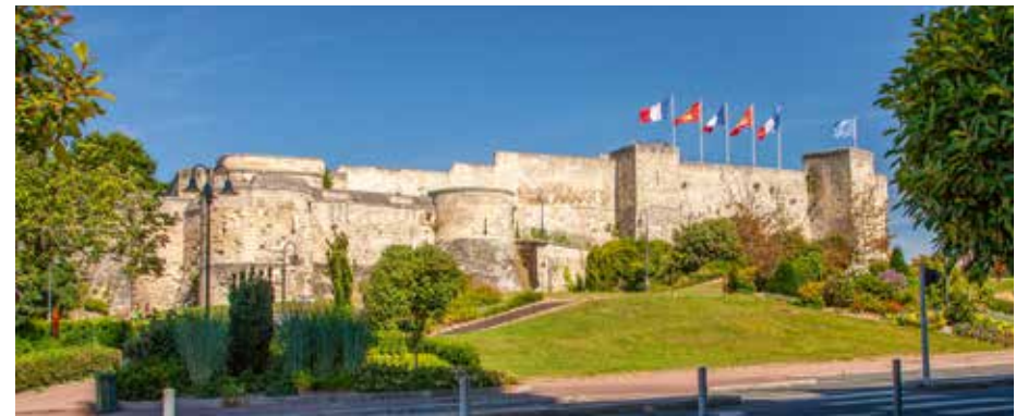
Château de Caen

Caen la Mer, premier pôle économique, industriel et académique de l’Ouest de la Normandie, est une source majeure d’opportunités de carrière. De plus, son accessibilité est assurée par un large réseau de transports incluant différentes lignes de TER, un aéroport international et un réseau autoroutier.