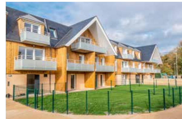
Opaline – 63 avenue Charles de Gaulle à CABOURG

VINCI Immobilier compte parmi les intervenants économiques majeurs en Normandie, avec des réalisations qui font référence.