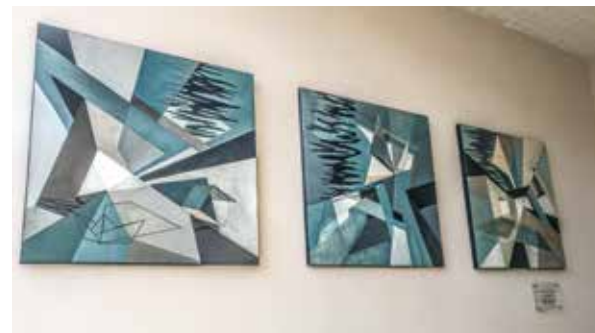
« Triptyque Vague » - Peinture acrylique - Artiste Annie LENOIR – Programme Plénitude à CAEN

Votre cadre de vie mérite d'avoir «sa» personnalité, c'est pourquoi nous intégrons l'Art au cœur de nos résidences. À travers la charte « 1 immeuble, 1 œuvre », chaque projet accueille la création d'un artiste local, en parfaite harmonie avec l'architecture et les espaces partagés. Plus qu'un simple embellissement, chaque réalisation apporte une touche unique de caractère, de poésie et d'inspiration.