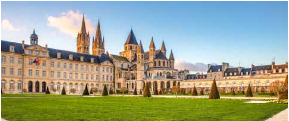
Abbaye aux hommes de Caen