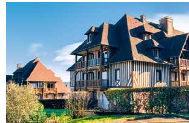
Les terrasses du Mont Canisy – 26 avenue Strassburger à DEAUVILLE