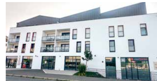
Plénitude – 1 rue de Lebissey à CAEN