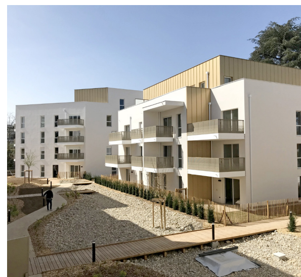
SPHERE - Tassin-la-Demi-Lune - Livré en 2025

VINCI Immobilier compte parmi les intervenants économiques majeurs d'Auvergne Rhône-Alpes, avec des réalisations qui font référence.