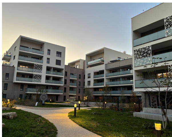
Résidence MAJUSCULE, Annecy - Livrée en 2023

Nos logements sont imaginés en harmonie avec votre mode de vie. Espaces lumineux, matériaux de qualité, extérieurs généreux, isolation thermique et acoustique, optimisation des volumes... Chaque détail est pensé avec soin, chaque mètre carré valorisé et nos plans déjà meublés : une exigence de conception au service de votre confort d'été comme d'hiver. Pour longtemps.