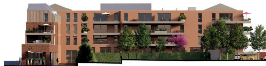
Façade cœur d'îlot