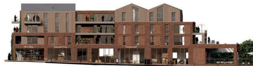
Façade rue du 6 juin 1944