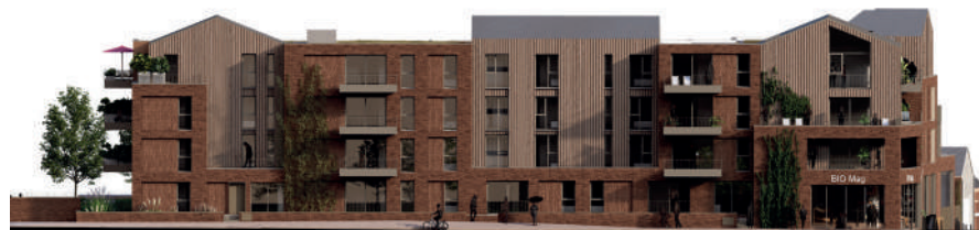
Façade rue de la Marjolaine

Végétalisation du stationnement aérien par des pavés joints gazon, afin de le faire disparaître un maximum.