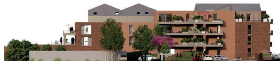
Façade cœur d'îlot