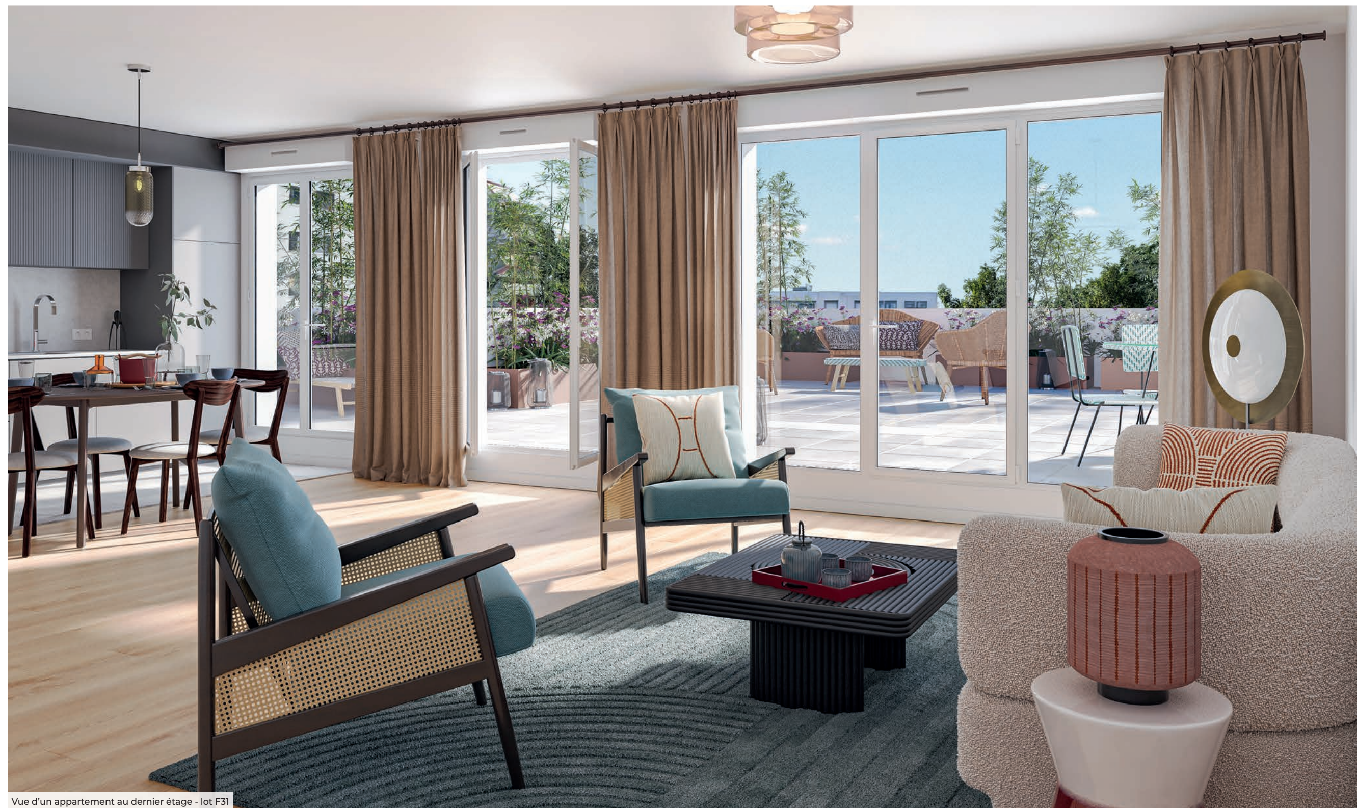
Vue d'un appartement au dernier étage - lot F31