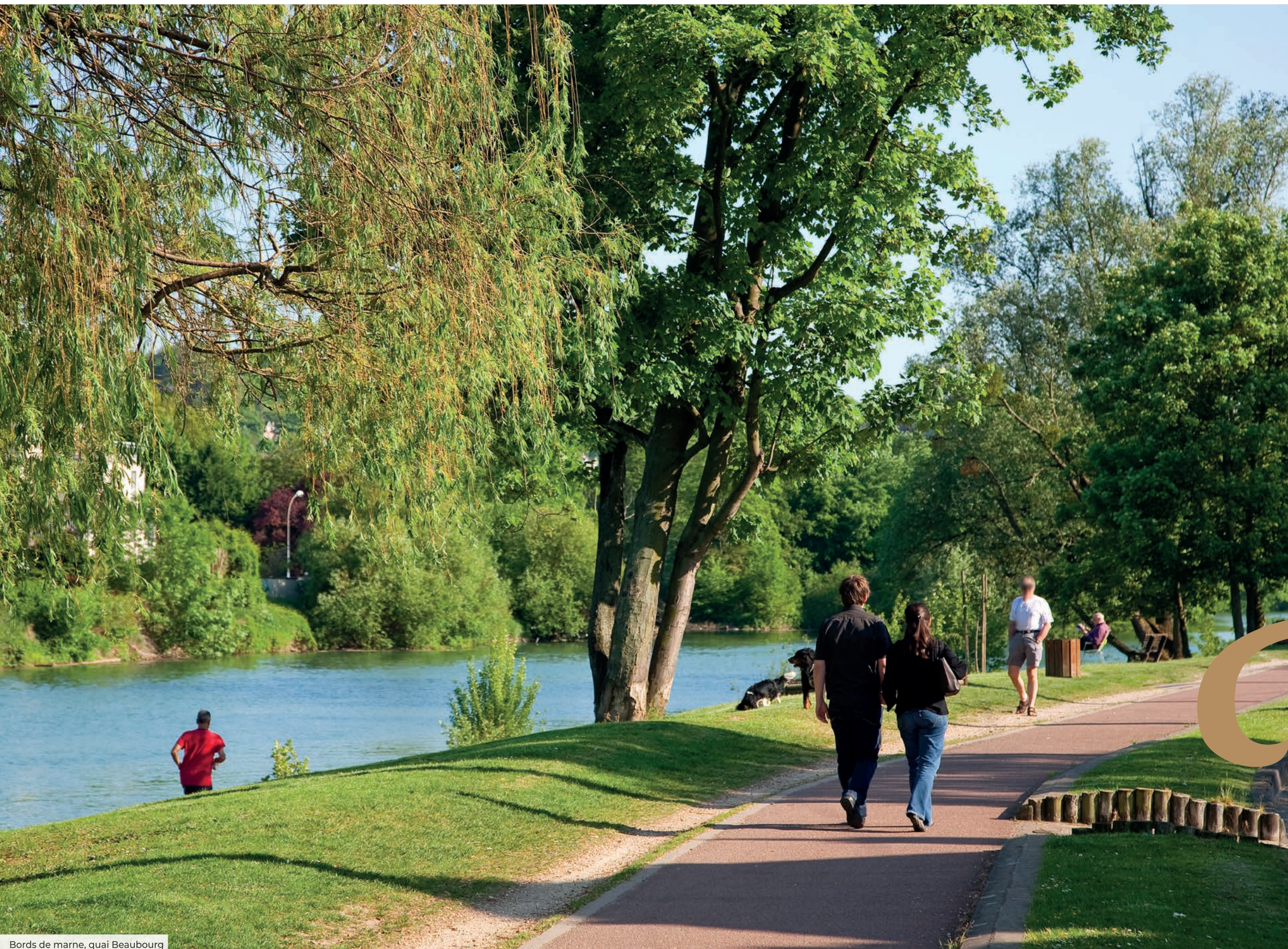
Bords de marne, quai Beaubourg