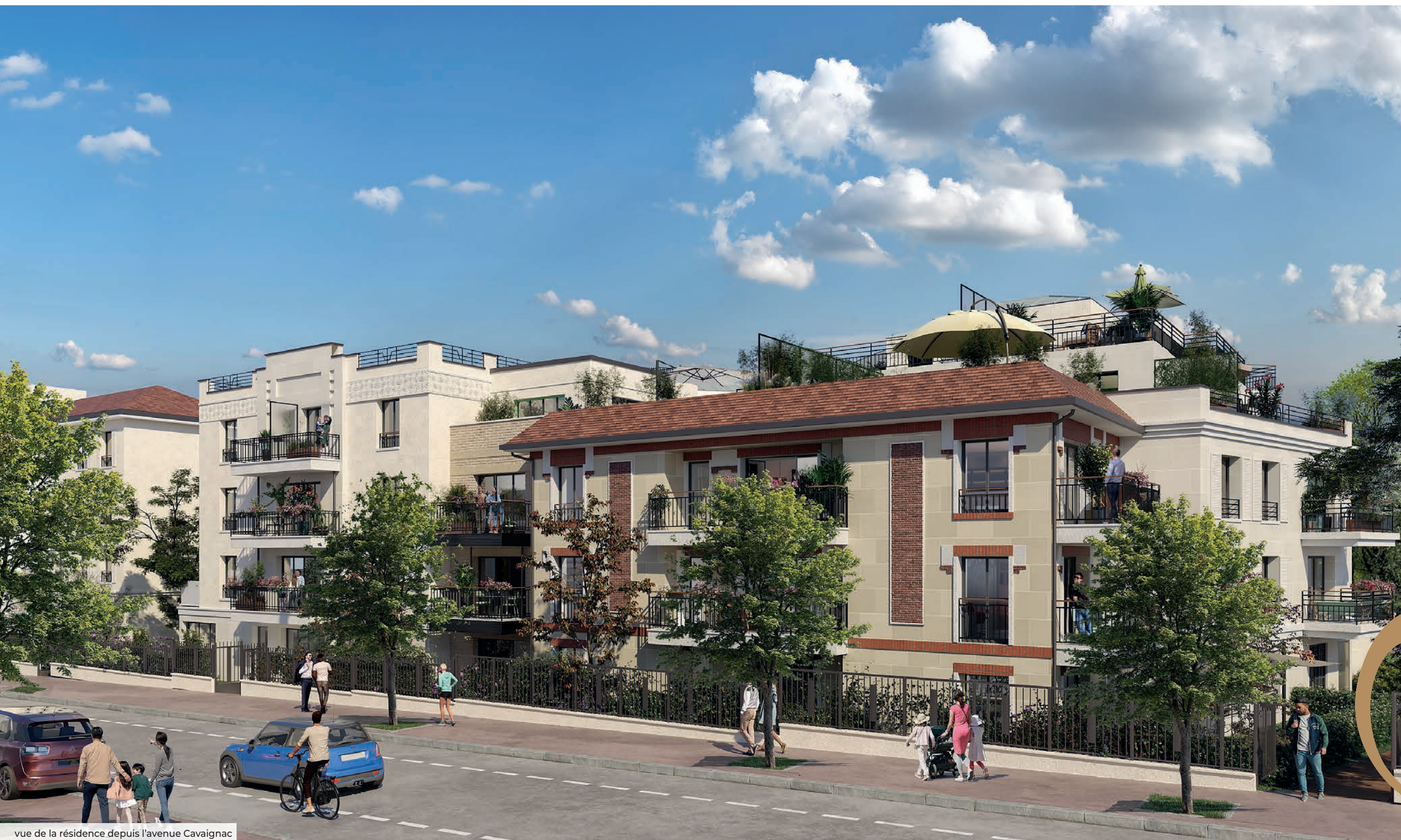
vue de la résidence depuis l'avenue Cavaignac