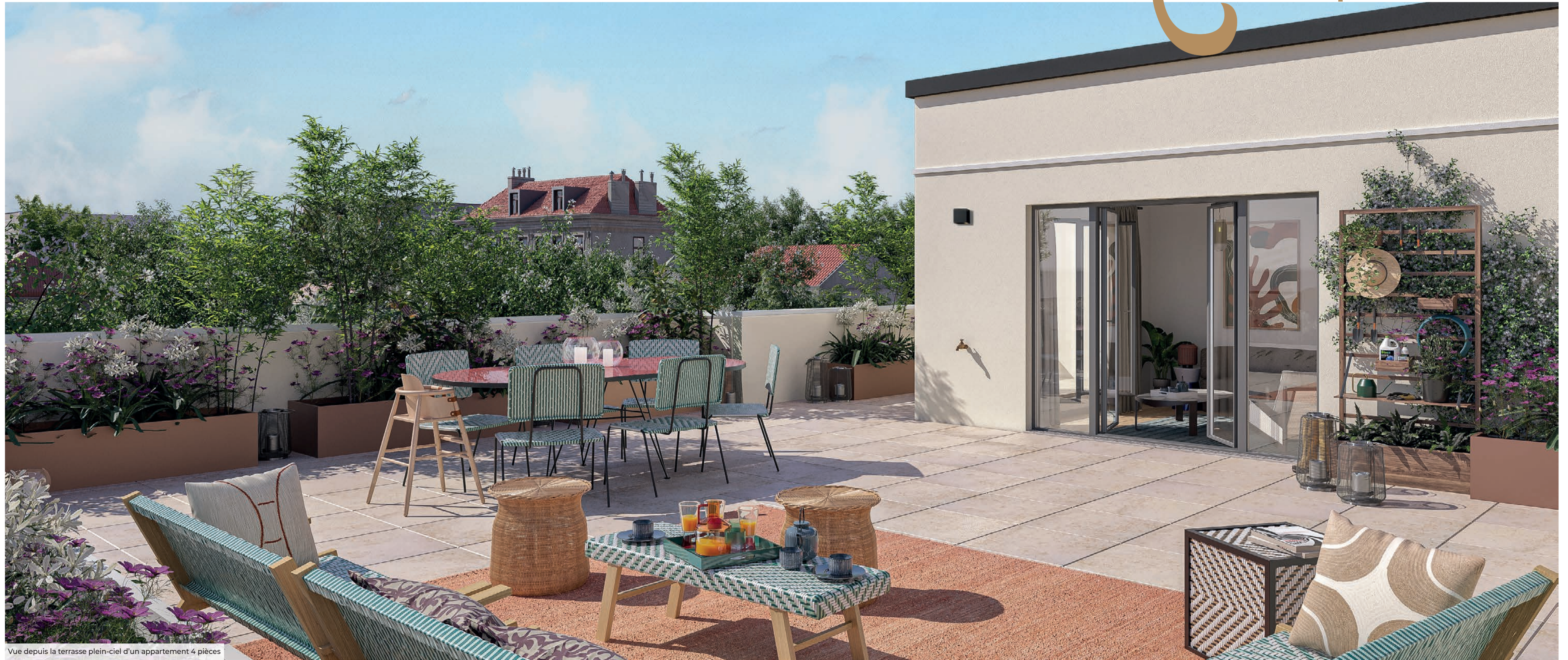
Vue depuis la terrasse plein-ciel d'un appartement 4 pièces