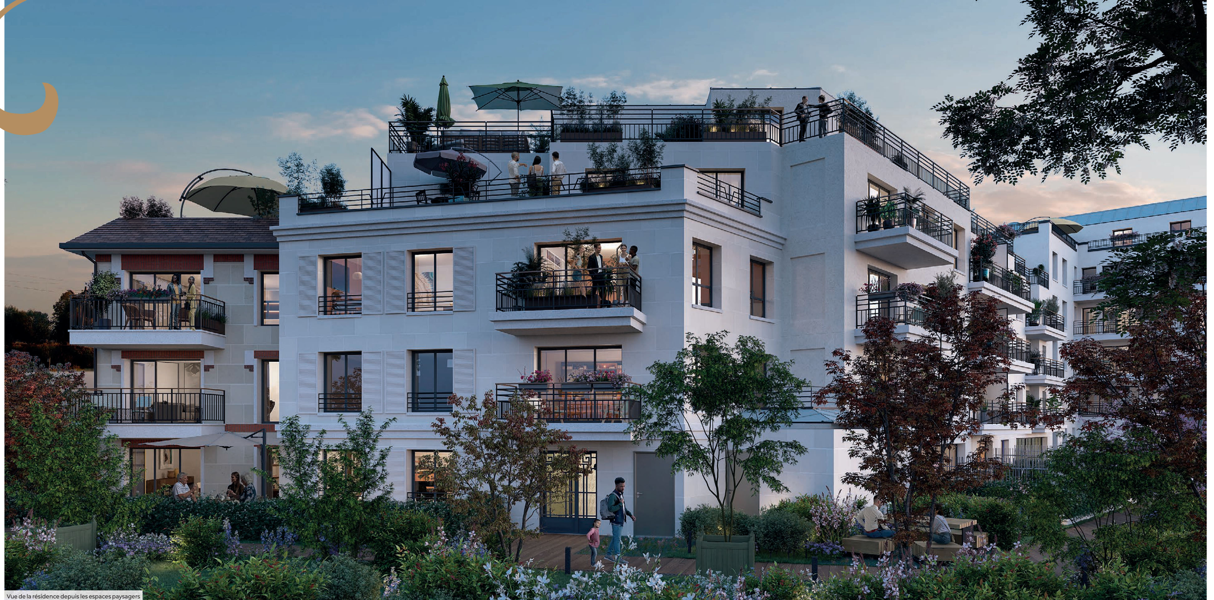
Vue de la résidence depuis les espaces paysagers