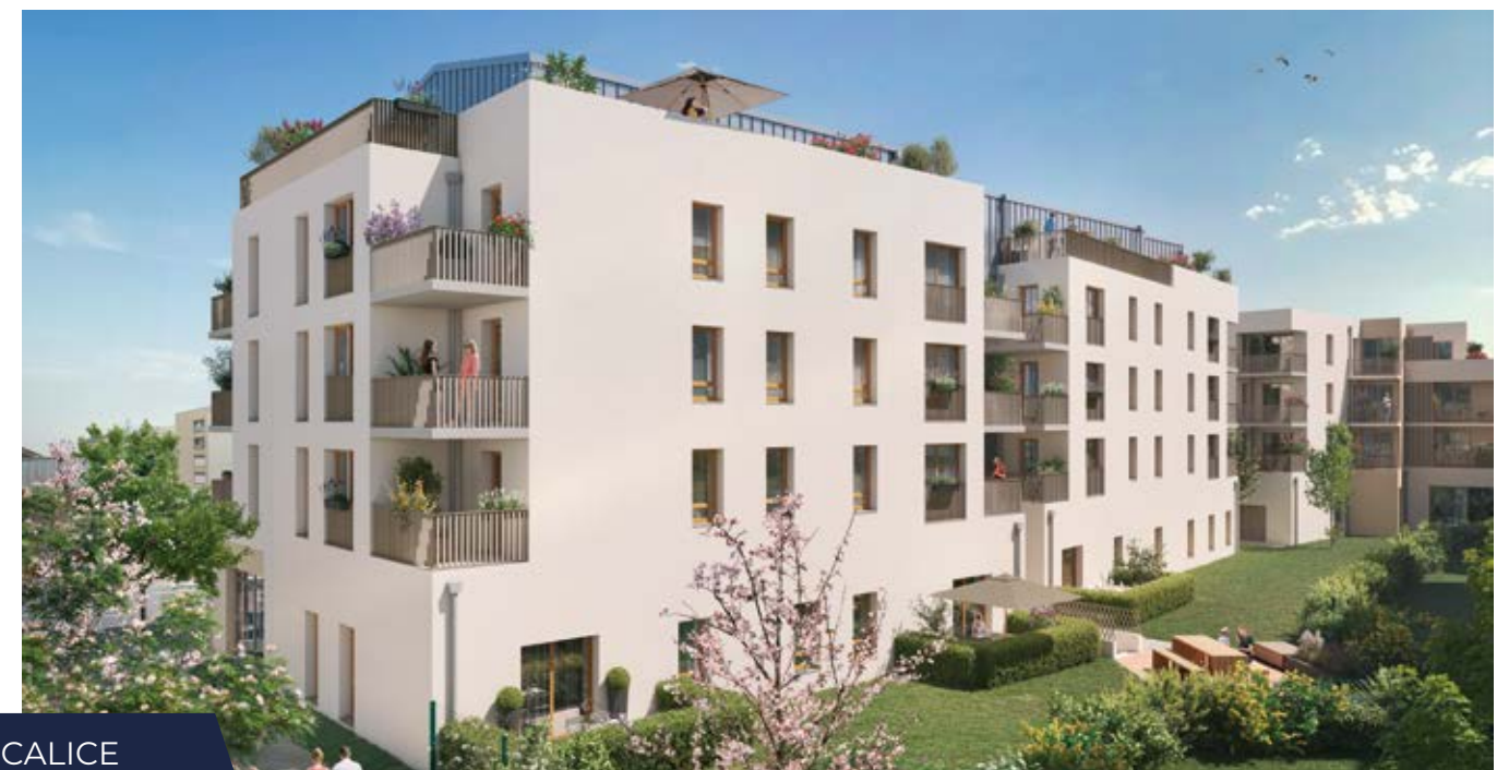
LE CALICE BRIGNAIS (69)