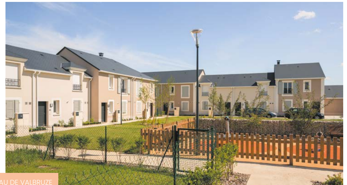
LE HAMEAU DE VALBRUZE FONDETTES (37)