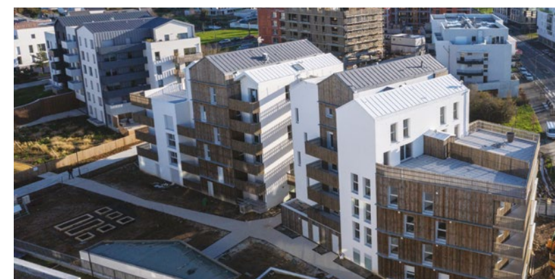
RÉSIDENCE ICONIK à ANGERS

Pour vous, la garantie de pouvoir compter sur une réelle proximité.