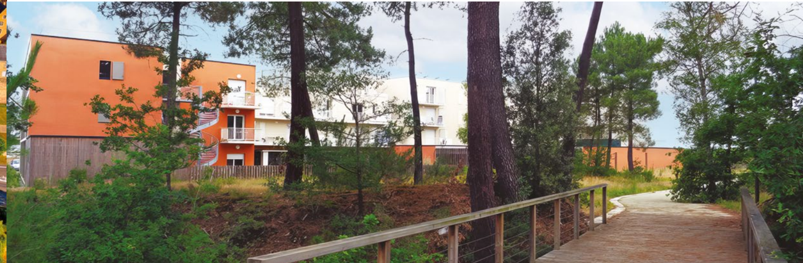
Le parc boisé au cœur de la ZAC de la Cartoucherie