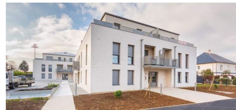
RÉSIDENCE ELIXYR à SAINT-CYR-SUR-LOIRE