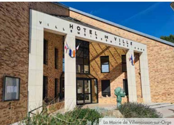
La Mairie de Villemoisson-sur-Orge