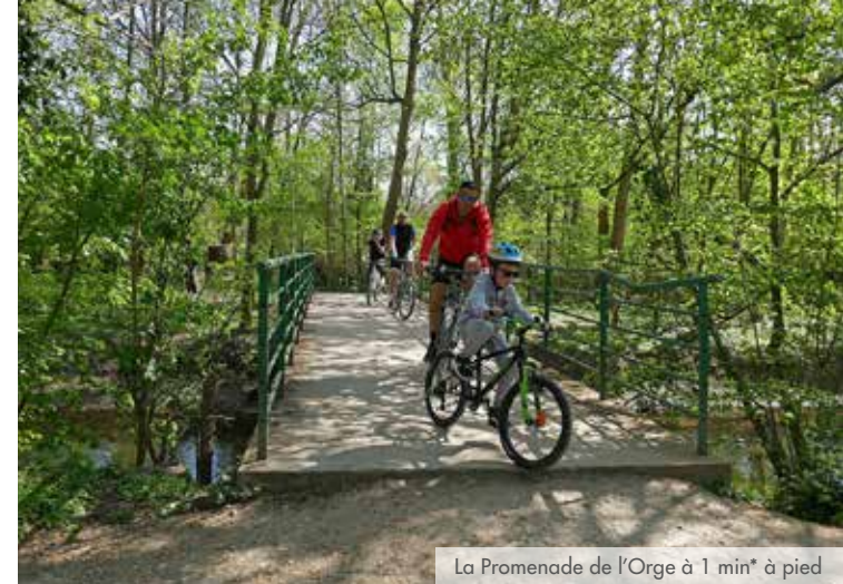
La Promenade de l'Orge à 1 min* à pied

À 20 km* de Paris, Villemoisson-sur-Orge concilie agréablement activités citadines et douceur de vivre. Cette petite commune d'un peu plus de 7 000 habitants a su conserver son âme de village et les charmes de son patrimoine naturel. Elle s'est développée avec équilibre pour offrir à ses habitants les infrastructures scolaires, culturelles et sportives ainsi que des associations pour faciliter le quotidien et s'épanouir en famille.