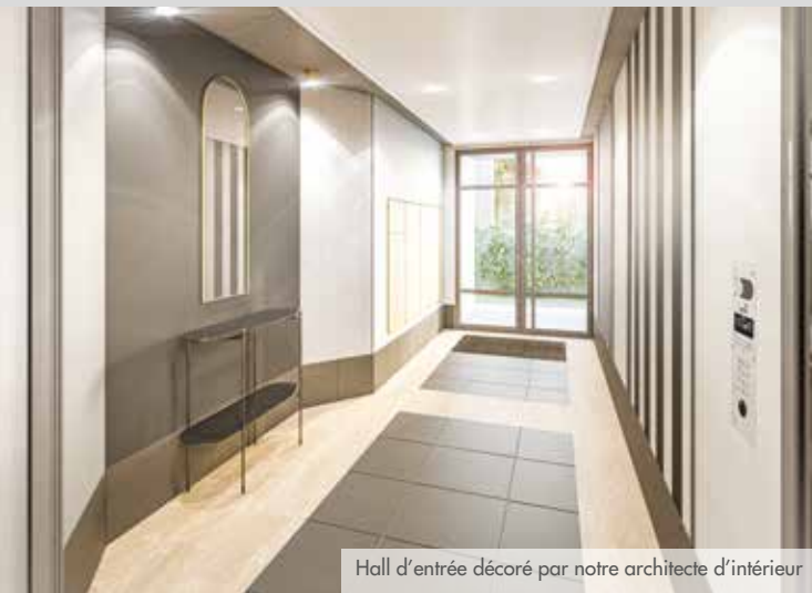
Hall d'entrée décoré par notre architecte d'intérieur