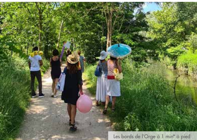
Les bords de l'Orge à 1 min* à pied